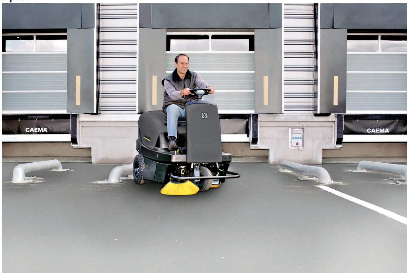
KM 100/100 R Lpg